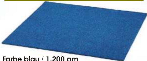
Farbe blau / 1.200 qm

Teppichboden für Messe-/ Sporthallen. Schnelle und leichte Verlegung durch großes Fliesenmaß ( 2,00m x 1,00m) Nadelfilzfliesen mit Concord Plusrücken.