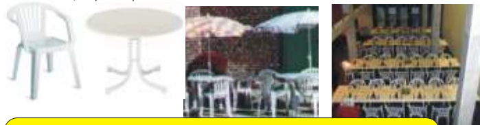
Ø 1,00m / 5 Pers.

Plastikstessel weiß Wetterbeständige Gartensessel aus Plastik mit Sitzkissen, dazu passende Kunststoffische in weiß.